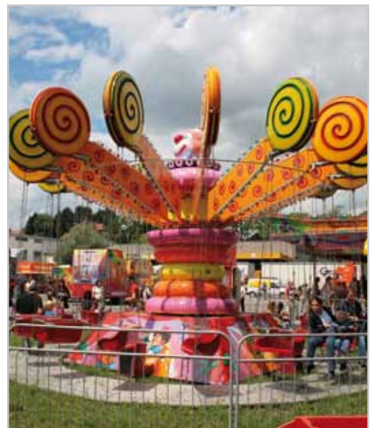
Ein Vergnügungspark für die Kleinen.

Für diese Veranstaltung ist es notwendig, einen Bereich der Innenstadt, Teile der Werdenbergerstraße und der Wichnerstraße, für den Fahrzeugverkehr zu sperren. Die lokalen Umleitungen sind ausreichend beschildert.