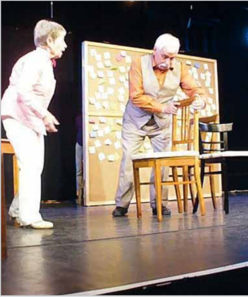
Das Theater Ostschwung zeigt das Thema Demenz von einer anderen Seite.

„Eine andere Welt“ am Sonntag, 27. September, in der Remise