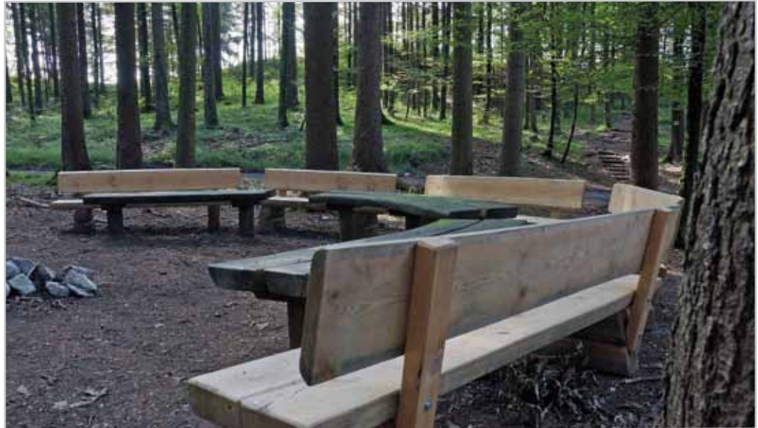
Auch Bänke und Tische entlang des Waldlehrpfades werden erneuert - ein Teil wurde schon im Sommer 2015 getauscht.