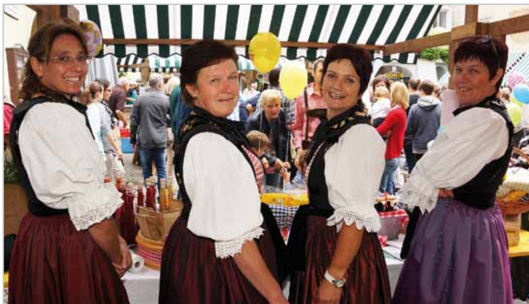
Bäuerinnen aus der Region präsentieren ihre Produkte auf dem Erntedankmarkt.

Nähere Infos: Stadtmarketing Bludenz, Werdenbergerstr. 42 6700 Bludenz, Tel. 05552-63621- 258