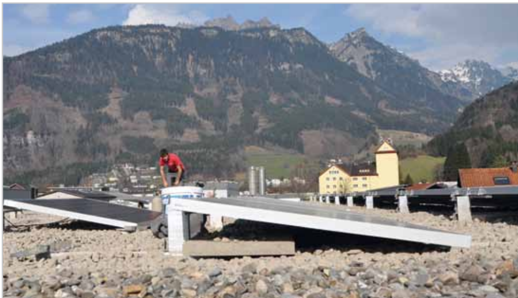
Eine Photovoltaik-Anlage gibt es auf dem Dach des Werkhofes Klarenbrunn.

Weitere Photovoltaik-Anlagen auf städtischen Gebäuden geplant