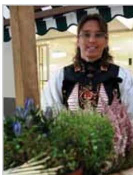
Erntedank in der Innenstadt