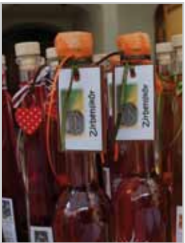
Heimische Produkte aus der Region

Am Samstag, 19. September, präsentiert sich die Bludenzener Mühlgasse als Marktplatz der Region: An über 15 Ständen treffen sich Trachten, heimische Lebensmittel und Kunsthandwerk.