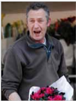
Die Marktschreier aus Norddeutschland sind diesmal auch wieder dabei.

Marktfeeling pur gibt es am ersten Oktoberwochenende in der Bludener Innenstadt. Der große Herbstmarkt steht am Samstag und Sonntag, 3. und 4. Oktober, in der Bludener Innenstadt auf dem Programm.