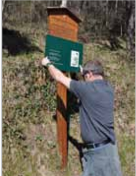
Die Infotafeln werden neu gestaltet.

Tourismusverein arbeitet gemeinsam mit der Stadt an Neugestaltung