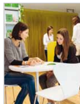
aha und Jugendservicestelle feiern Geburtstag