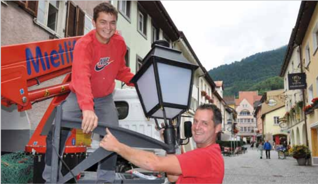
Von Mitarbeitern unseres Elektropartners Steiner wurden die neun Lampen montiert.

Straßensanierung und Erneuerung der Wasserversorgung