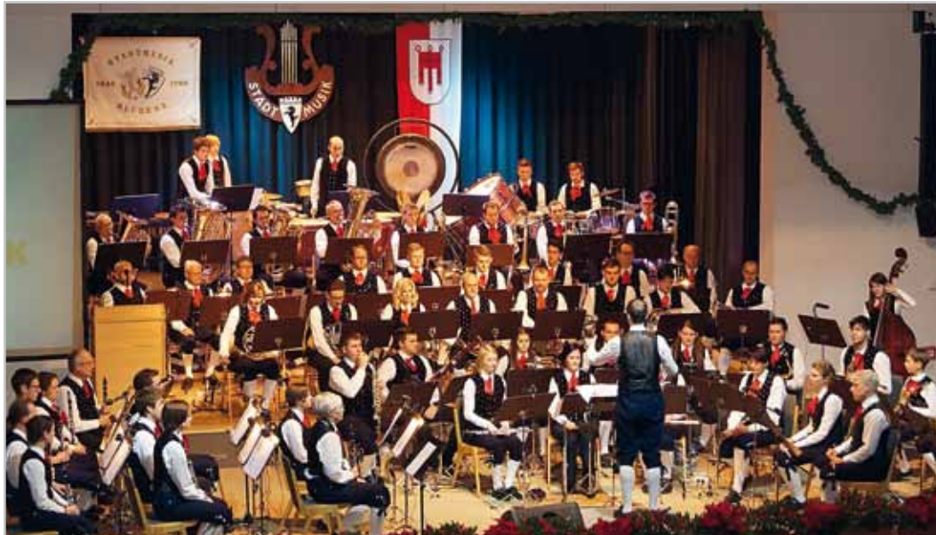
Verschiedene Stilrichtungen stehen bei den Cäciliakonzerten auf dem Programm.