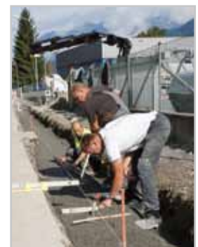
Die Arbeiten in der Klarenbrunnstraße und im Bereich Fohrenburgstraße sind in vollem Gange.