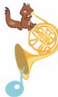
Cinello - Zaubhafte Waldmusiken