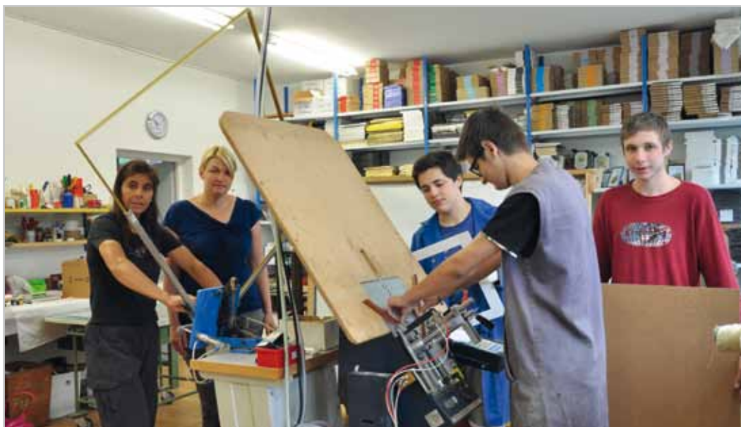
Ein neues Betätigungsfeld haben die Jugendlichen in der Bilderrahmenwerkstatt.

Bilderrahmenwerkstatt setzt Bilder richtig in Szene