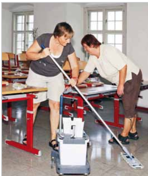
Die Stadt Bludenz hat im Sommer in die Infrastruktur von Schulen investiert.

Belastungen „von außen“ werden für Stadt immer spürbarer