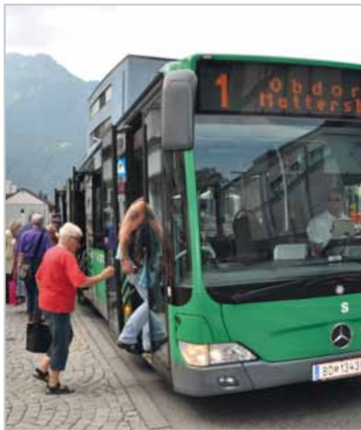
389 Personen nahmen an der Stadtbus- umfrage teil.