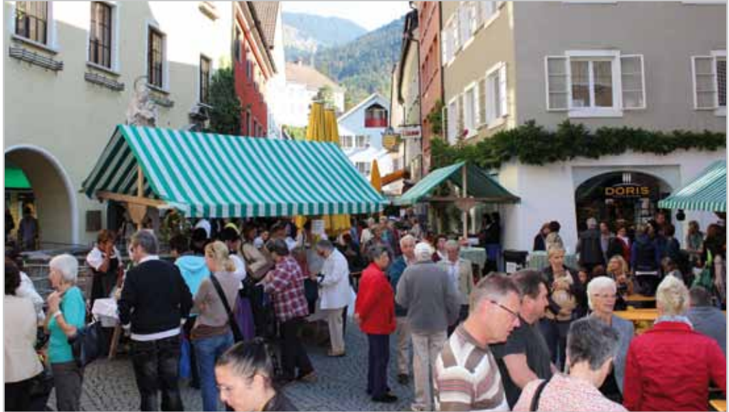
Das erste Oktoberwochenende steht ganz im Zeichen des Herbstmarktes.