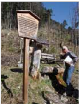
Auch Erlebniselemente sollen in den neuen Waldlehrpfad eingebaut werden.

Eines der Naherholungsgebiete der Stadt Bludenz ist der Bereich des Montikels und des Buchwaldes. Seit vielen Jahren ist der Waldlehrpfad, der von der Tobelbrücke bis hin zur Hinteren Ebene am Montikel führt, fixer Bestandteil im „Familienspazierprogramm“.