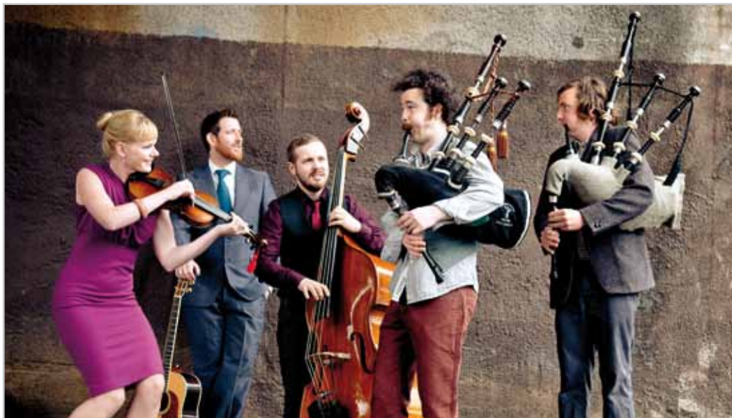
fremde.nähe - Breabach, dynamische Highland Bagpipes und schottische Melodien.