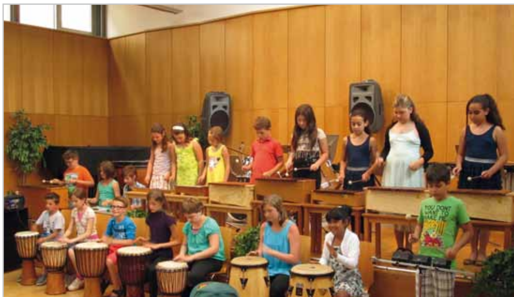
Die Ganztagsklasse GTK4 beim Konzert in der Musikschule.

Städtische Musikschule Bludenz, St. Peter-Straße 1 6700 Bludenz, Tel. 05552-63621- 426 musikschule@blu- denz.at www.bludenz.at/ musikschule