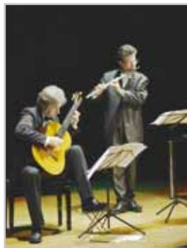
bühne.frei - FluTar

Momente voller Inspirationen, Begegnungen und Euphorie für Klein und Groß verspricht das neue Programm. Mit Unterstützung der Sparkasse Bludenz, Hauptsponsor von Bludenz Kultur, werden neue Impulse gesetzt.