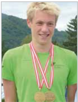
... und stolz mit seinen Medaillen

Ein Traditionsverein ist der Schwimmclub Bludenz. Schon 1926 wurde er gegründet und seither stehen Trainings-einheiten, Teilnahme an Wettkämpfen, Vereinsmeisterschaften und vieles mehr auf dem Programm des Schwimmclubs VAL BLU.