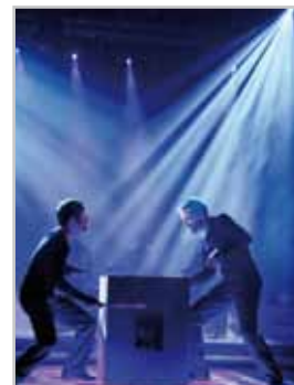
kinder.welten - Double Drums

Abonnements für 4 Veranstaltungen der Reihe fremde.nähe 2015/16 sind ab sofort bei Bludenz Kultur erhältlich.