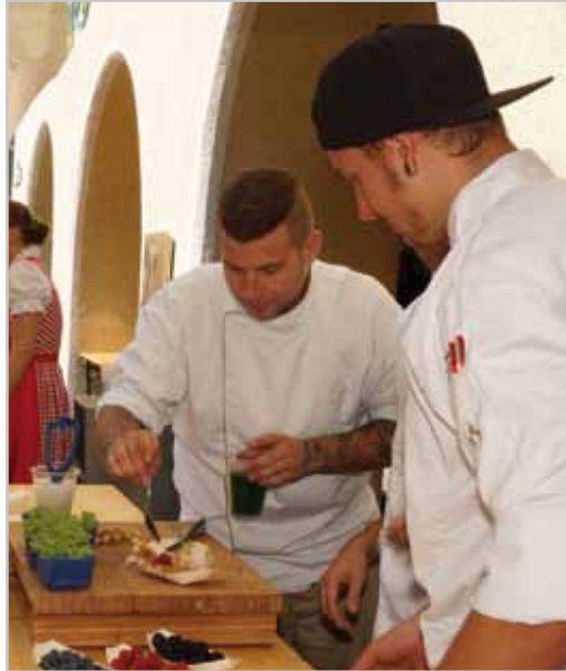
7.000 Besucher beim Street Food Festival.

den - ein Zeichen mehr, dass Bludenz sich nicht verstecken muss sondern erhebliches Potential hat. Unter diesem Gesichtspunkt sollen bestehende Veranstaltungen kritisch hinterfragt und neue Formate entwickelt werden. Für 2016 konnte dieses Top-Event bereits wieder fixiert werden.